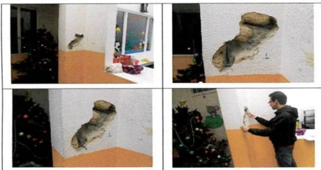
Jardín Infantil Playón Playita

Encontramos una columna de concreto reforzado S=20 \times 35 con refuerzo longitudinal en varilla de 3/8 " corrugada y estribos de D=3/8 " liso espaciados cada 26 cm. El recubrimiento es de 2 cm. En las fotos se puede observar los refuerzos encontrados.